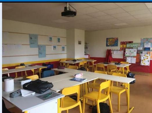
La salle de la classe à effectif réduit de 6 e