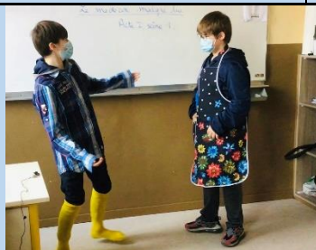
Pièce de théâtre en classe