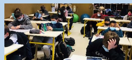
Pendant l'opération « un Ange passe »