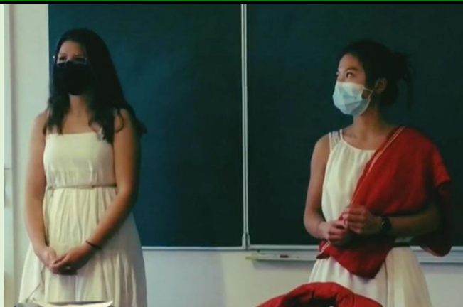
Activité en classe