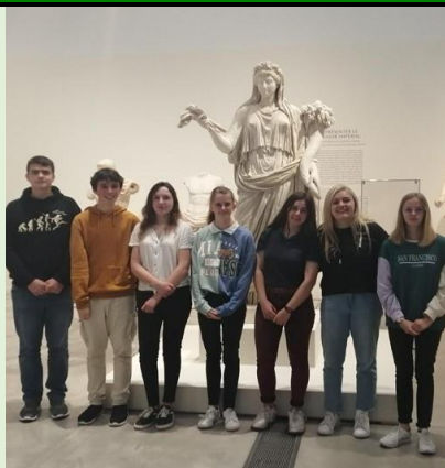
En sortie pédagogique au Louvre-Lens