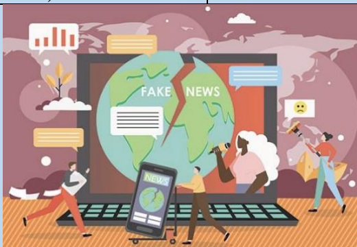
Etwining sur les Fakenews avec l'Ukraine