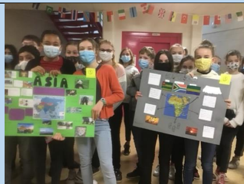
La découverte des continents en 6 e