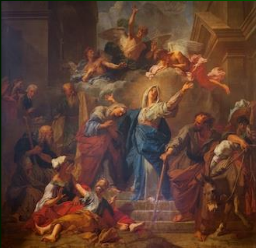
Jean-Baptiste Jouvenet - 1716 - ND de Paris