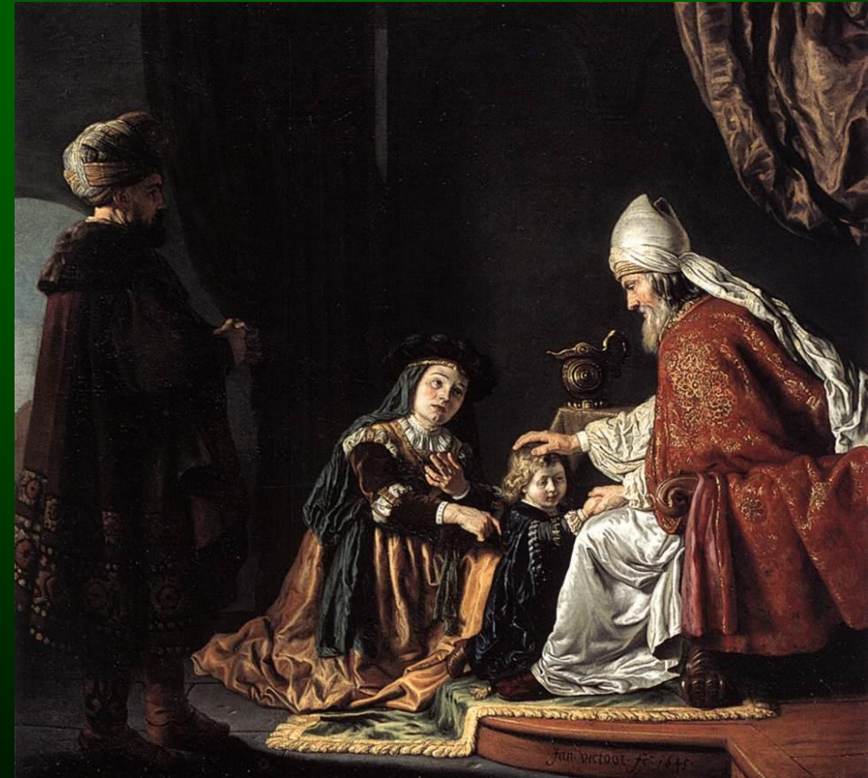
Jan Victors - 1645 - Berlin